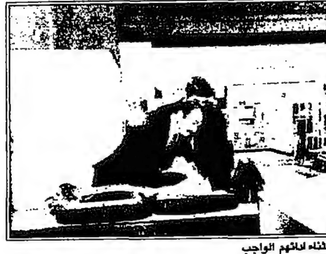
الثناء لانهم التواجب